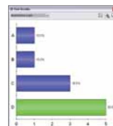
Se resultaten på en gång