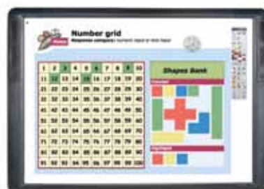
Typ av svar: siffror eller text

Lyckohjulet (Wonder Wheel) är ett gränssnitt som lägger sig ovanpå andra program (och kan användas med de flesta program). Det fångar elevernas intresse och uppmuntrar till deltagande och engagemang under hela lektionen