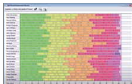
Möjlighet till frågor i egen takt och anpassade frågor